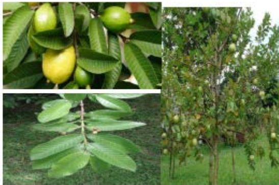
Gambar Jambu Biji