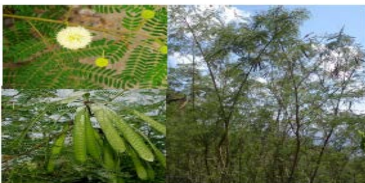
Gambar Petai Cina

Leucaena leucocephala (Lmk. de wit.), Leucaena glauca , Benth.