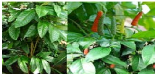
Gambar Cabe Jawa