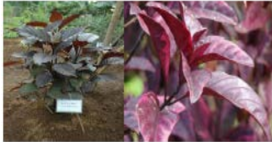
Gambar Daun Wungu