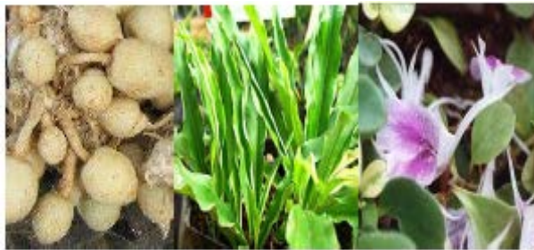
Gambar Kunci Pepet