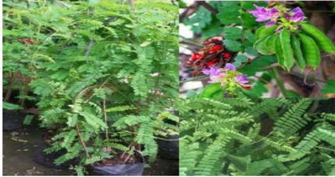
Gambar Saga Rambut