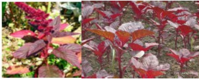
Gambar Bayam Merah