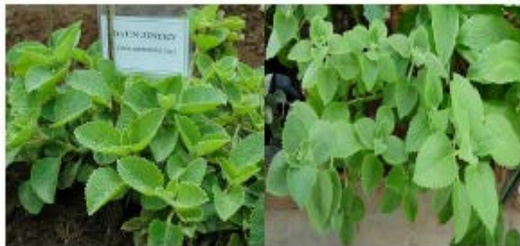
Gambar Daun Bangun-bangun