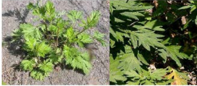
Gambar Baru Cina