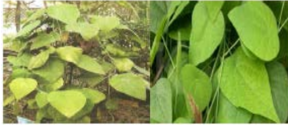
Gambar Daun Cincau