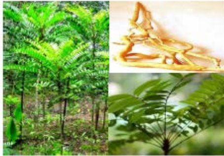
Gambar Pasak Bumi