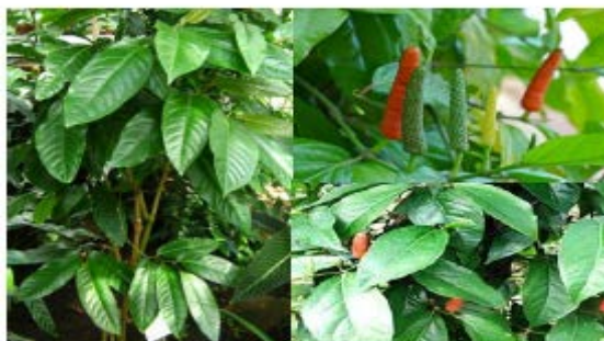
Gambar Cabe Jawa