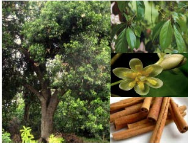
Gambar Kayu Manis