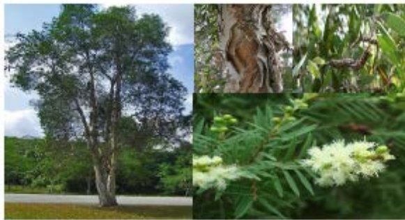
Gambar Kayu putih