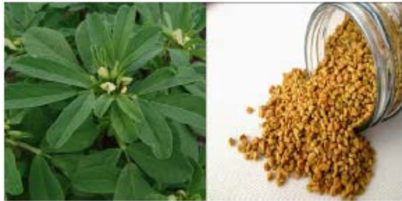
Gambar Biji Klabet