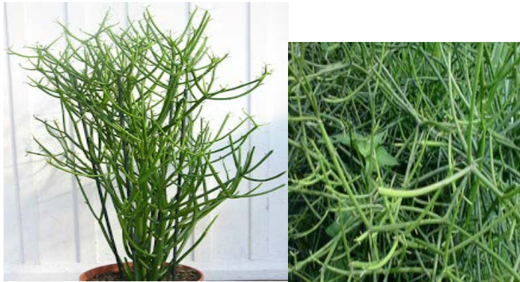
Gambar Patah Tulang