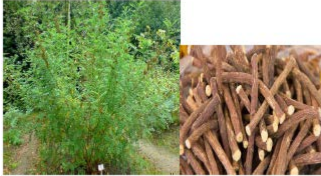
Gambar Akar manis