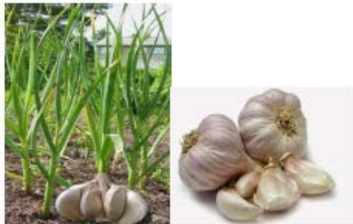
Gambar Bawang Putih