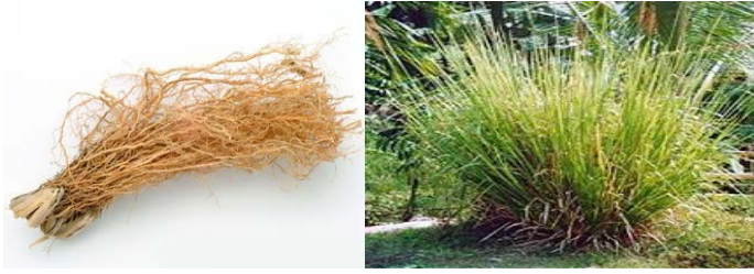
Gambar Akar Wangi