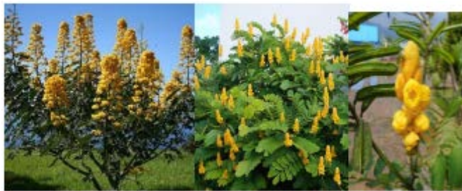
Gambar Ketepeng cina