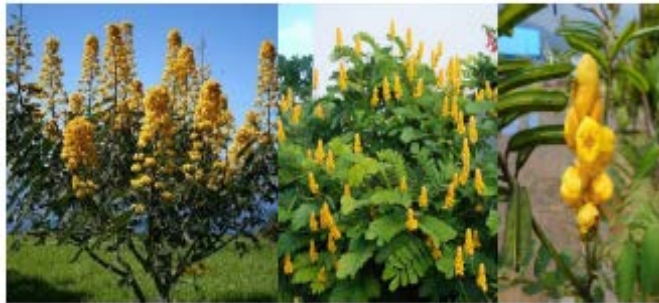
Gambar Ketepeng cina