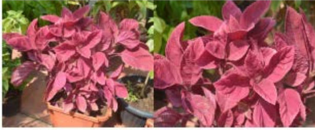
Gambar daun iler