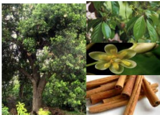
Gambar Kayu Manis