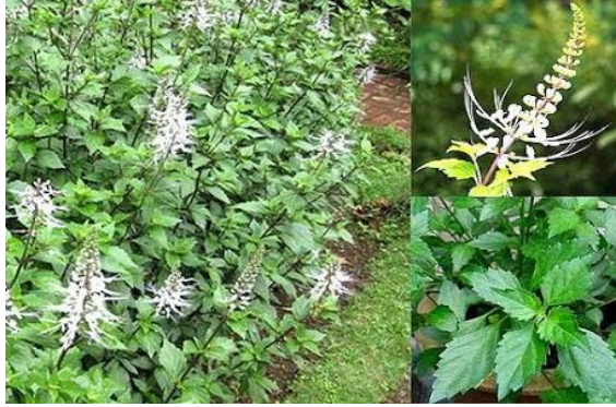
Gambar Kumis Kucing