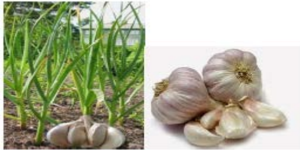
Gambar Bawang Putih