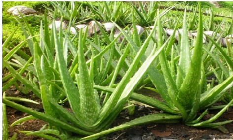
Gambar Lidah Buaya