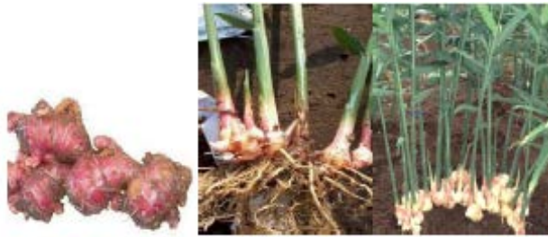
Gambar Jahe Merah