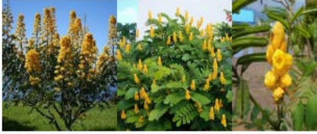
Gambar Ketepeng cina