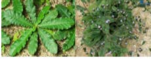
Gambar Tapak Liman