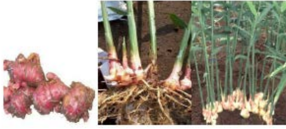
Gambar Jahe Merah