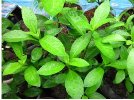
Gambar Sambung Nyawa