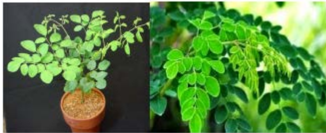
Gambar Tanaman Kelor