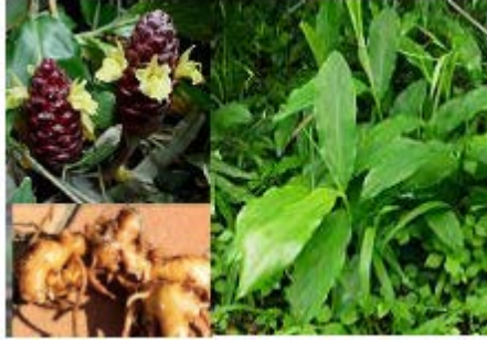
Gambar Lempuyang Wangi

Zingiber aromaticum Valetton & Van Zijp.