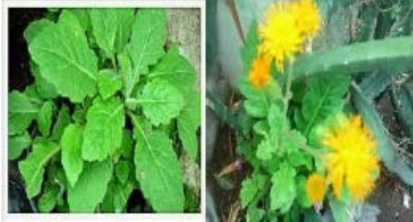
Gambar Daun Dewa

Gynura divaricata , G segetum (Lour.) Merr.