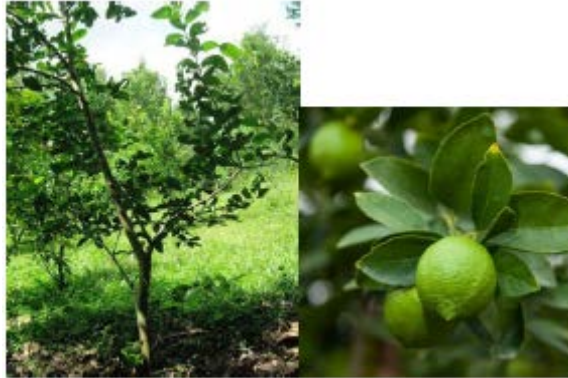
Gambar Jeruk Nipis