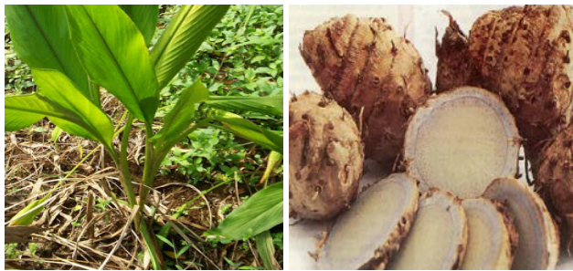
Gambar Temu Hitam