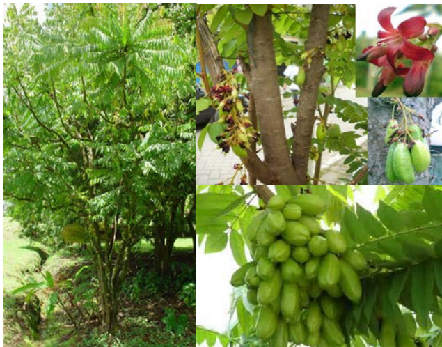
Gambar Belimbing Wuluh