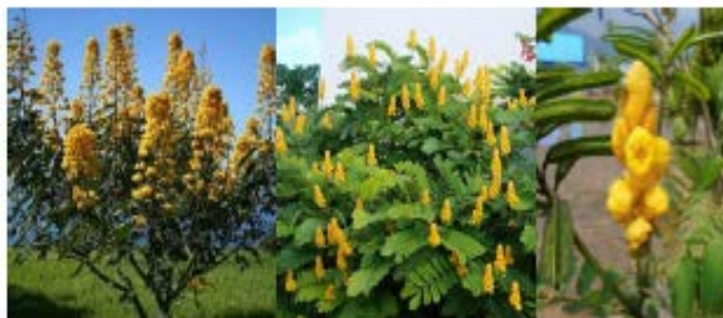
Gambar Ketepeng cina