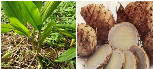
Gambar Temu Hitam