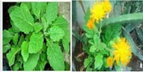
Gambar Daun Dewa