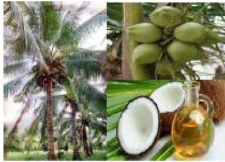
Gambar Minyak Kelapa